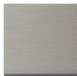
HABA G-Alu25 Standardqualität